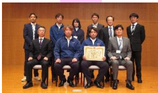
エンジェルキッズ