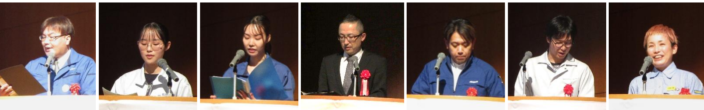
ONE by ONE