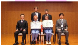
加工グループ盛り上げ隊