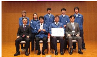
ONE by ONE