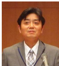
中嶋地区長代理 (株)アイシン福井

第6685回QCサークル体験事例発表会 （主催：QCサークル北陸支部福井地区、後援：福井県・経営品質協議会・経営者協会）が、11月28日（金）に福井県自治会館にて開催されました。今回は、県内7社の企業が取組んだQCサークル活動（小集団改善活動）の体験事例発表が行われました。