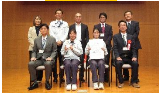
最先端を支える女たち