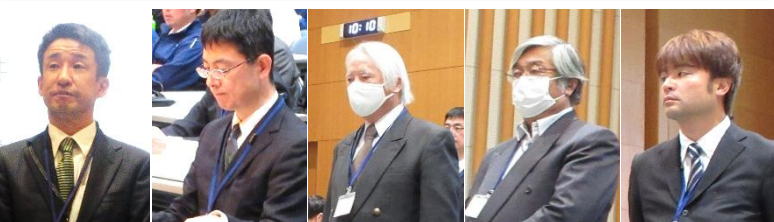
福井県 産業労働部 野尻室長