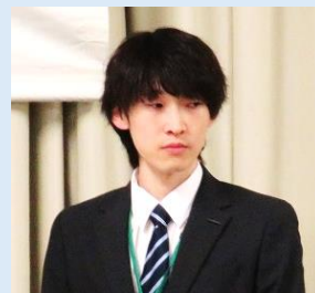
日産自動車(株)横浜工場