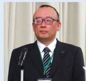
コニカミノルタ(株)