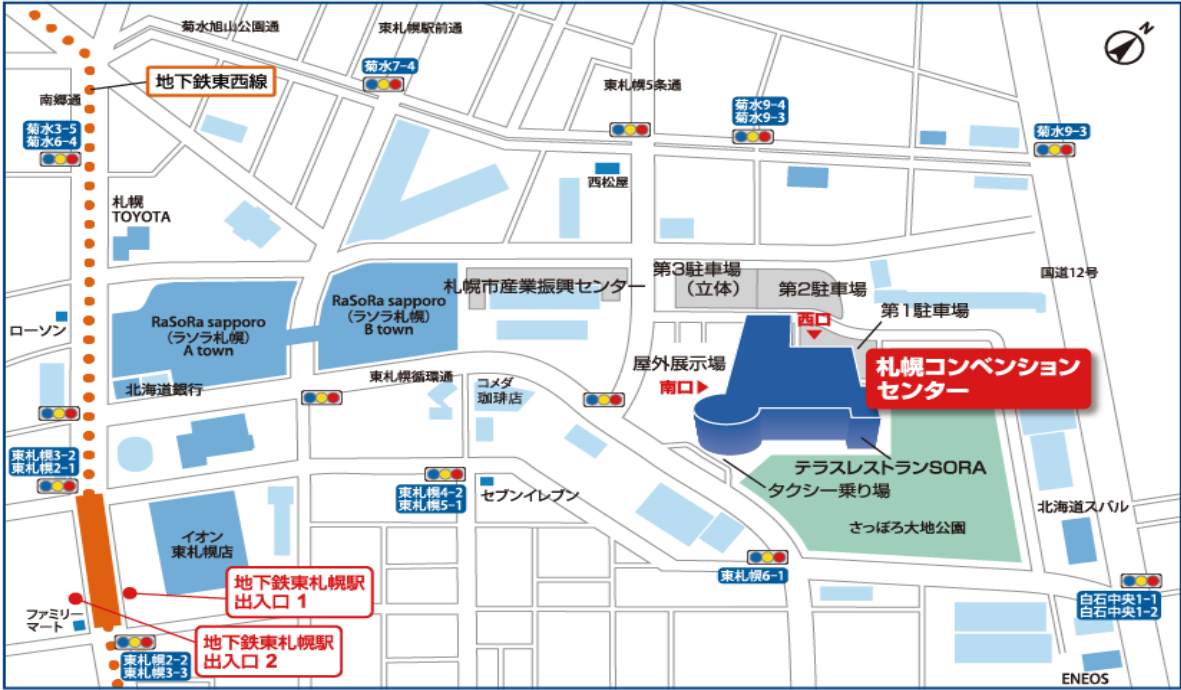
図1 札幌コンベンションセンター周辺マップ

<交通アクセス> 札幌コンベンションセンターは地下鉄東西線/東札幌駅が最寄り駅です。