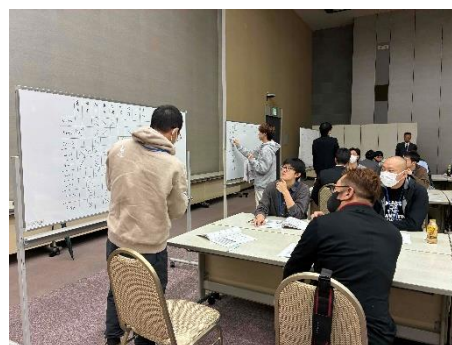
GD (グループディスカッション)