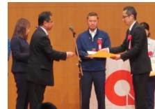
エスパスサークル