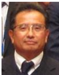
開会挨拶：八田地区長 セーレン株式会社

第6597回QCサークル体験事例発表会（主催：QCサークル北陸支部福井地区、後援：福井県・経営品質協議会・経営者協会）が、11月29日（金）に福井県自治会館にて開催されました。今回は、県内6社の企業が取組んだQCサークル活動（小集団改善活動）の改善事例発表が行われました。