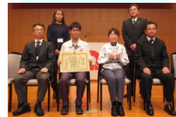
ハピネスラボサークル