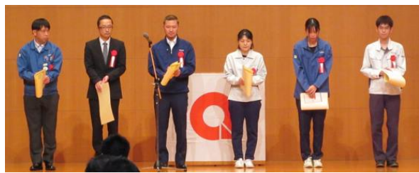
サークルの代表者の皆さん