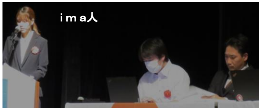
【埼玉県経営者協会会長賞授与】