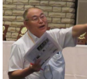
【講評】 小玉地区認定講師