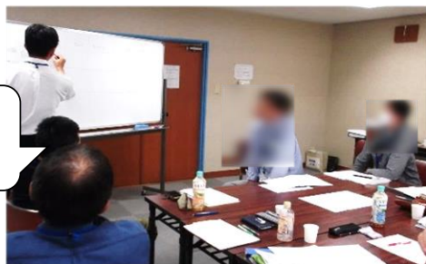
【グループディスカッション】