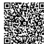
参加申し込みフォームQR

研修会概要情報 https://qc-members.jp/kinki/osaka_kinkiminami/event/4480