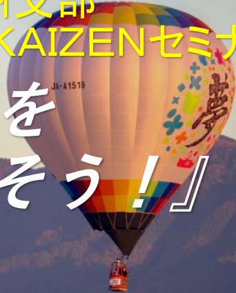
写真：佐賀バルーンフェスタ

後援：QCサークル本部・（一財）日本科学技術連盟 主催：QCサークル九州支部 西部九州地区