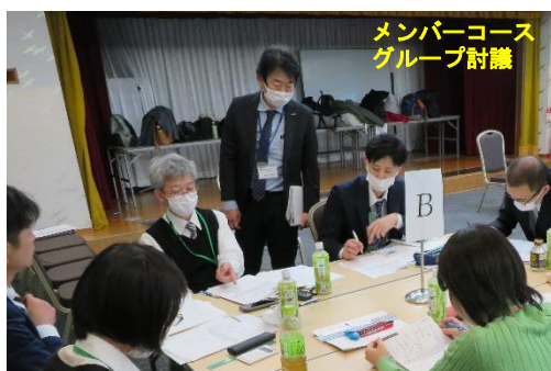
メンバーコース グループ討論

2023年11月16、17日（木・金）湯沢ニューオータニホテルにて、「2023年度秋期QCサークル研修会」が開催されました。8社、33名という方にご参加いただき、各社のQCサークル活動、人材育成への取組み意識が高いことを感じることができました。研修はQC手法の効率的な活用方法について学ぶ「メンバーコース」と、実践的テーマを題材にしてQC手法の効果的な活用方法を身につける「リーダーコース」の2コースを開講し、QCサークル活動について学んで頂きました。