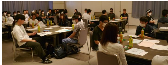
開会挨拶：受講者の皆さん