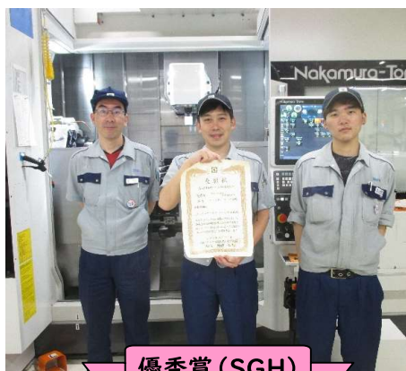
優秀賞 (SGH) マイスター