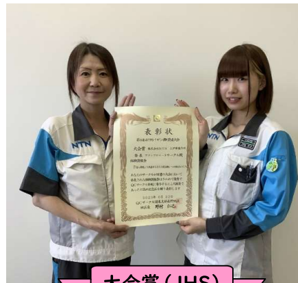
大会賞 (JHS) プランプロモート