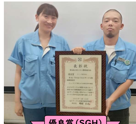
優良賞 (SGH) Change Gears

★審査の結果、NTN(株)長野製作所の研削★Aサークル、(株)NTN上伊那製作所のプランプロモートサークルが「大会賞」を受賞し、2023年11月17日に行われる長野地区チャンピオン大会出場が決定しました。