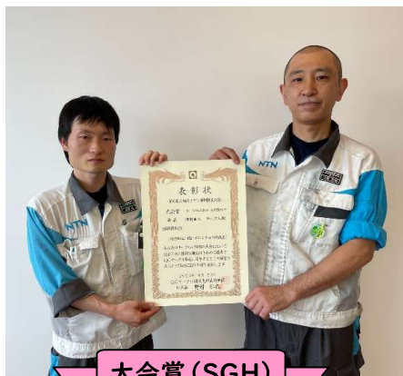
大会賞 (SGH) 研削★A