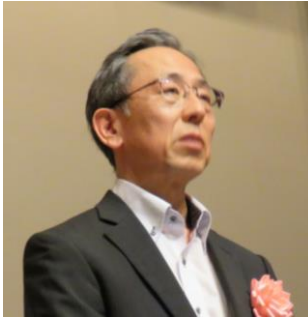
【来賓】 板倉事務局次長