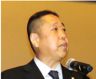
【開会挨拶】 矢萩地区長