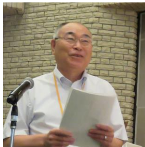
【講評】 小玉地区認定講師