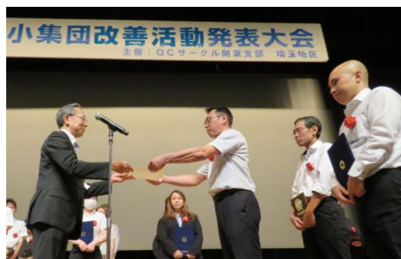
JHS部門 増幸産業株式会社 明るい声サークル