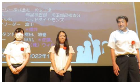
【レッドダイヤモンドズ】