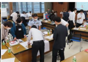
グループディスカッションの様子