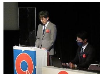
【てくてく4サークル】