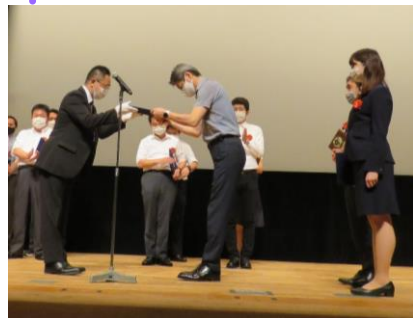
審査員特別賞を受賞した JHS部門 チームM I Dサークル (太陽インキ製造株式会社 本社)