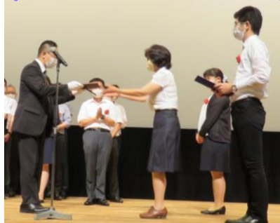
SGH部門金賞受賞した M設Sサークル (株式会社安川電機 入間事業所)