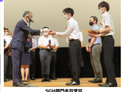
SGH部門金賞受賞 埼玉県経営者協会会長賞を受賞した チームバイカー●サークル (グローリー株式会社 埼玉工場)