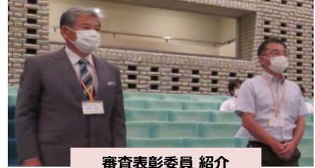
審査表彰委員 紹介