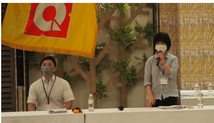
パネルディスカッションではいろいろな意見を交わしました。