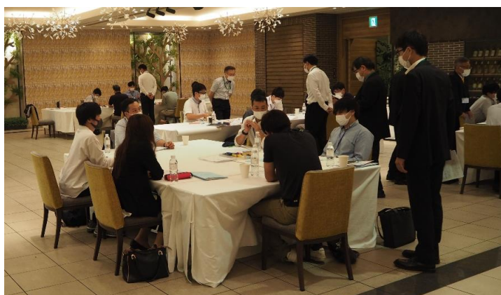
熱心にブレインストーミング法でディスカッションをする受講生の皆さん